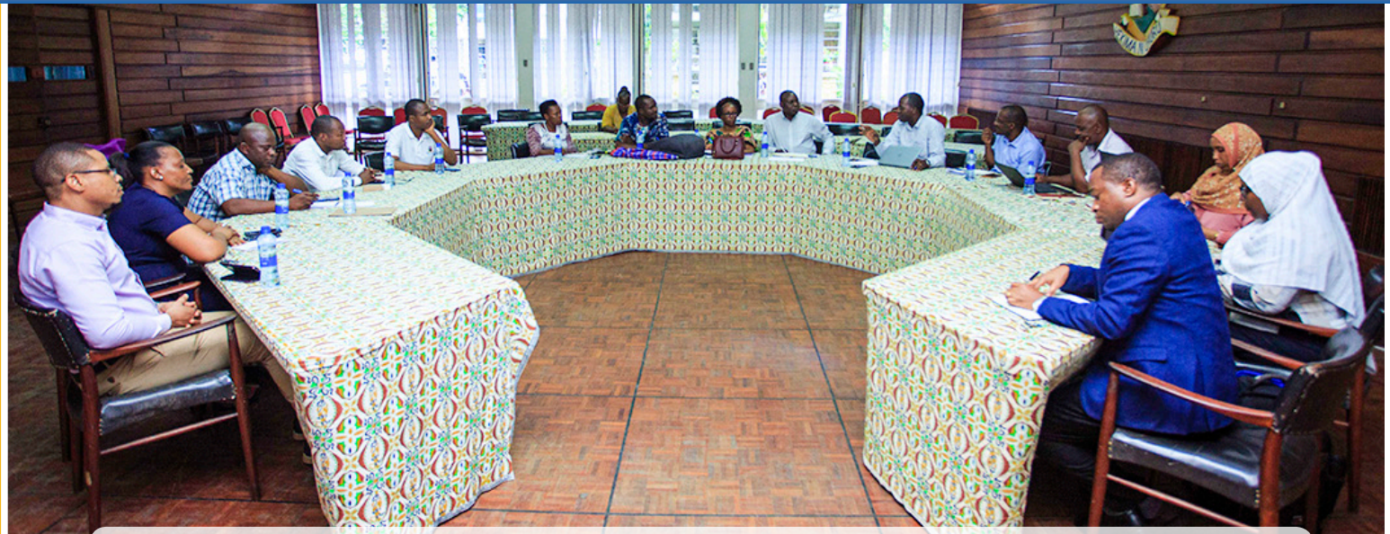
Ushirikishwaji Wadau: Mkutano na Viongozi wa UDASA