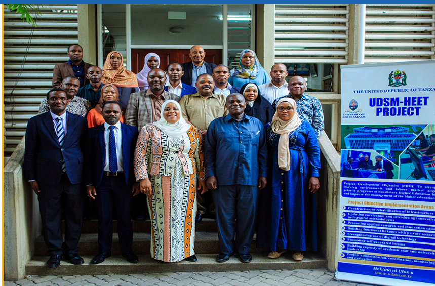
Wajumbe wa Kamati ya Kudumu ya Bajeti katika Baraza la Wawakilishi Zanzibar na wajumbe wa Kitengo cha Usimamizi wa Mradi wa HEET Chuo Kikuu cha Dar es Salaam wakati Kamati ya Kudumu hiyo ilipotembelea UDSM kujifunza kuhusu utekelezaji wa Mradi wa HEET.

Wajumbe wa Kamati ya Bajeti ya Baraza la Wawakilishi wamefanya ziara katika Chuo Kikuu cha Dar es Salaam, tarehe 16 Novemba, 2023 kujifunza mambo mbalimbali kuhusiana na utekelezaji wa Mradi wa HEET.