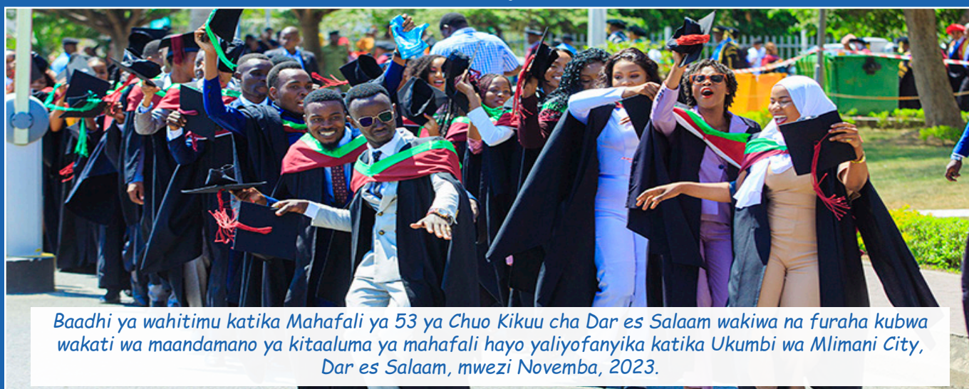
Baadhi ya wahitimu katika Mahafali ya 53 ya Chuo Kikuu cha Dar es Salaam wakiwa na furaha kubwa wakati wa maandamano ya kitaaluma ya mahafali hayo yaliyofanyika katika Ukumbi wa Mlimani City, Dar es Salaam, mwezi Novemba, 2023.

Mafanikio ya Mradi wa HEET yaliyoainishwa katika sherehe za mahafali ya Chuo Kikuu cha Dar es Salaam ni uthibitisho wa uwekezaji wa kimkakati katika sekta ya elimu ya juu, na kujenga mazingira ya kitaaluma yanayoendana na mahitaji ya jamii kwa wakati husika. Jambo muhimu la kuzingatia hapa ni kwamba mafanikio haya hayaishii tu kusherehekea mafanikio ya kitaaluma bali pia ni uthibitisho thabiti wa mustakabali bora wa elimu ya Tanzania.