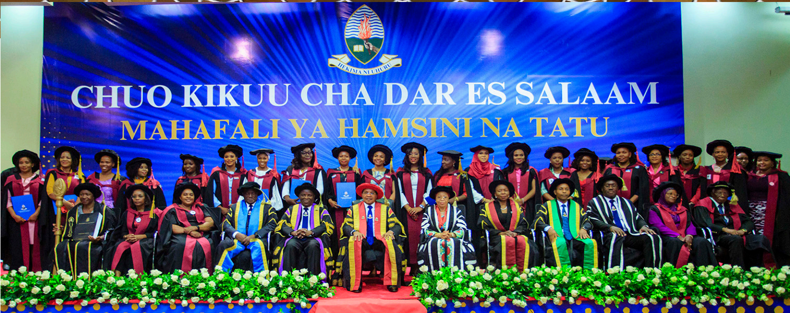
Mkuu wa Chuo Kikuu cha Dar es Salaam (katikati-waliokaa) na viongozi wengine wa Chuo wakiwa na wahitimu wa kike wa shahada ya Uzamivu katika Mahafali ya 53 ya UDSM yaliyofanyika Dar es Salaam mwezi Novemba, 2023.