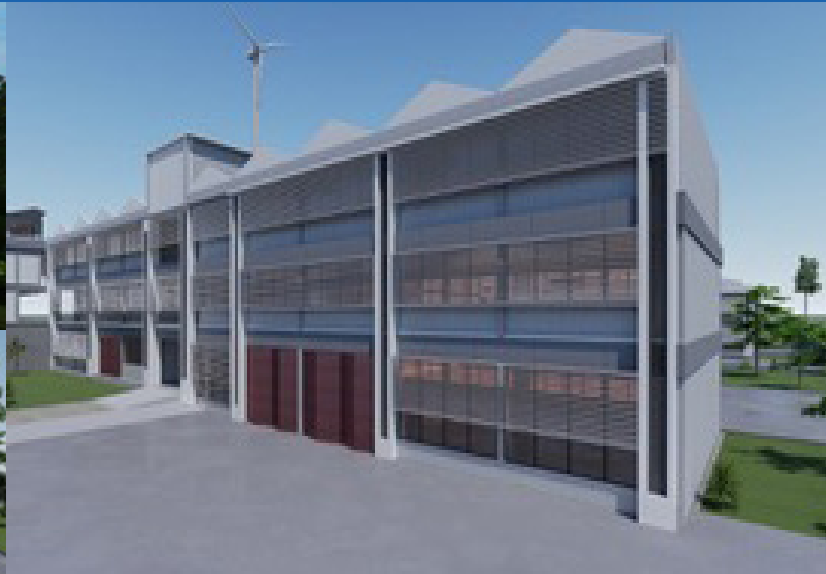
Picha za baadhi ya majengo mapya yanayojengwa katika kampasi mbalimbali za Chuo Kikuu cha Dar es Salaam kupitia mradi wa HEET.

Katika hatua ya kuhakikisha kwamba Mradi wa Elimu ya Juu kwa Mabadiliko ya Kiuchumi (HEET) unatekelezwa kama ilivyopangwa, Chuo Kikuu cha Dar es Salaam (UDSM), kimeunda timu kwa lengo la kuandaa mpango endelevu wa kusimamia utekelezaji wa Mradi.